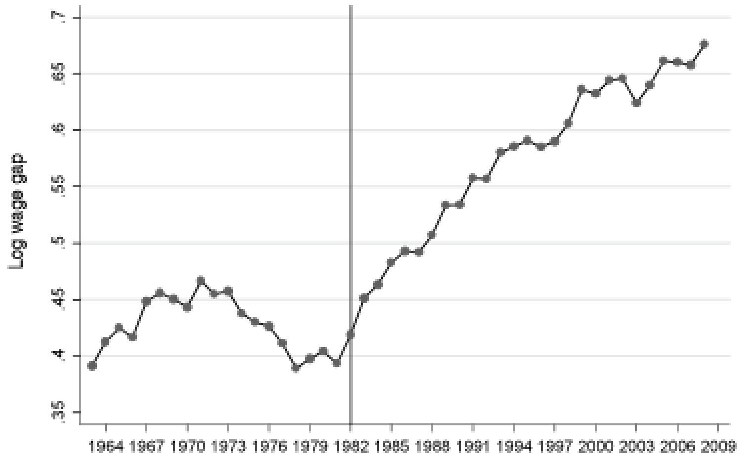
Composition adjusted college/high-school log weekly wage ratio, 1963-2008