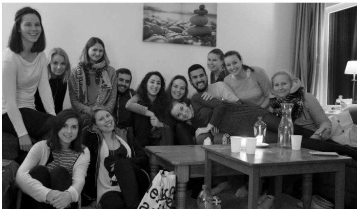
Internasjonale studenter fra hele verden.