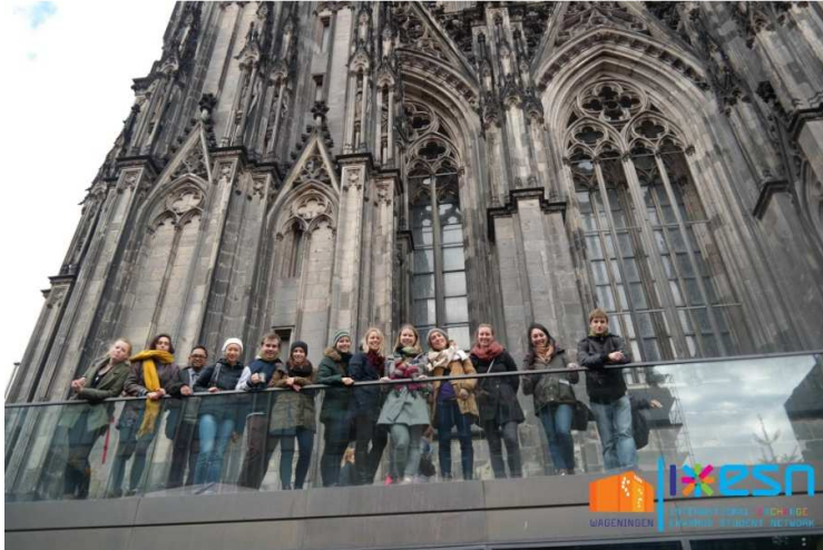
Köln i Tyskland.

hvordan Norge skiller seg ut fra andre land. Jeg har vokst vanvittig mye på denne erfaringen og sitter igjen med en forbedret engelsk, venner fra hele verden og minner for resten av livet. Jeg anbefaler alle på det sterkeste å dra på utveksling, dette er noe man bare får sjansen til en gang i livet!