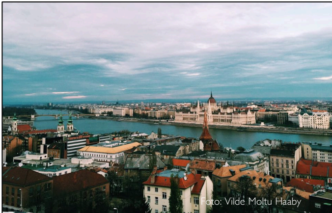
Budapest sett fra Buda

Jeg har ikke angret ett sekund på at jeg valgte Corvinus og Budapest som min utvekslingsdestinasjon. Kombinasjonen av den internasjonale atmosfæren, de nye perspektivene skolen ga meg, den fantastiske byen Budapest, det behagelige prisenivået, samt en lokalisering i hjertet av Europa, gjorde oppholdet mitt til et uforglemmelig semester. Jeg anbefaler utveksling til Corvinus på det varmeste!