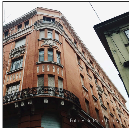
Fasaden på min leilighet i Semmelweis Utca distrikt V

Mange bodde på hotell den første tiden av deres utvekslingsopphold. Corvinus vil sende deg en liste over anbefalte hoteller og agenter å leie bolig gjennom før avreise. Du må aldri leie bolig uten at du har sett den først, da det er lett å bli lurt. Om du ønsker å ha et sted å bo klart til når du ankommer, vil jeg anbefale å spørre tandempartneren din om han/hun har mulighet til å gå på visning for deg. Prisnivået er betydelig lavere enn i Norge. Jeg bodde selv i en dyr leilighet etter ungarsk standard. Jeg betalte ca 4000 norske kroner i måneden for en fullt utstyrt 100 kvadratmeter stor leilighet midt i sentrum, som jeg delte med en annen. Jeg vil anbefale å se etter leiligheter i prissjiktet 2500-4500 kr pr person i måneden, avhengig av hvor mange du skal bo med.