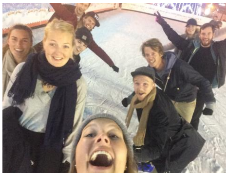
Gøy på skøytebane.