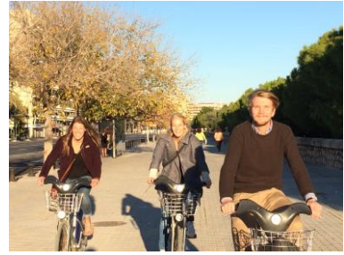
Lett å komme seg rundt med bysykler.