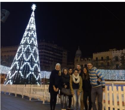
Kollektivet i gamlebyen