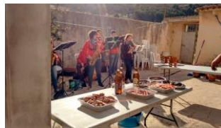
Her ble vi møtt av et orkes- ter