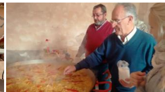
.. og paella til lunsj!