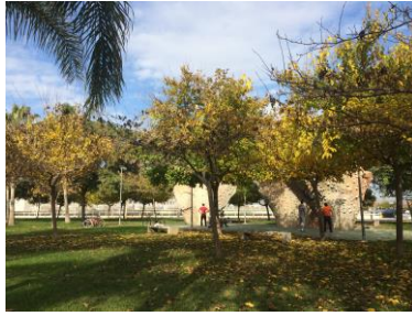
Buldring på campus.