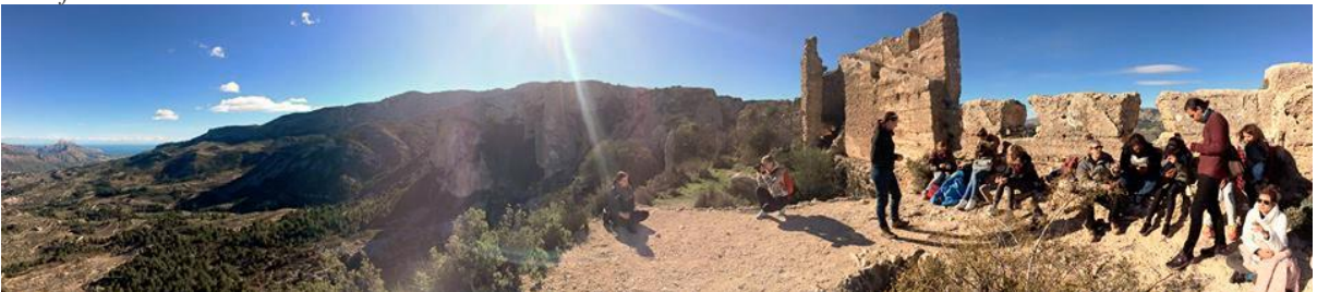
Og vi dro på fjelltur.