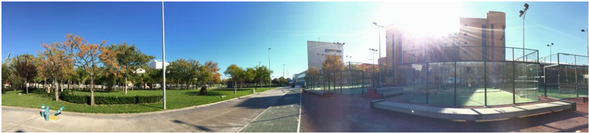
Tennisbaner og park på campus.

Professoren inviterte studentene til hjembygden sin.