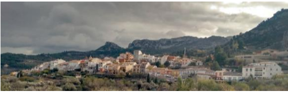
En fjellandsby i Alicante ved navn Confrides.

Professoren inviterte studentene til hjembygden sin.