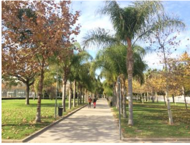
Palmer og høstfarger, 14 de-